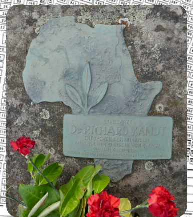
3. Richard Kandt