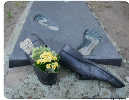
8. Schuhe (Orthpäde)